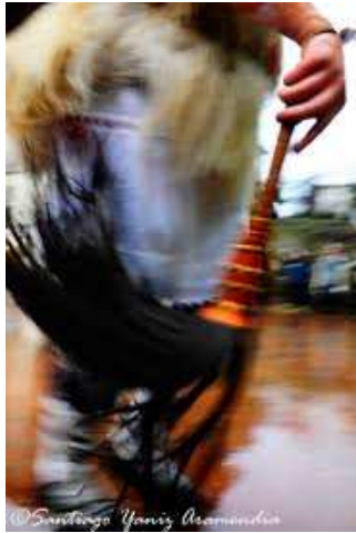
“Hixopua” zaldi isatsez egina, joalduna.

Lantzeko inauterian ere, “zaldikoa” pertsonaia aurkitu dezakegu.