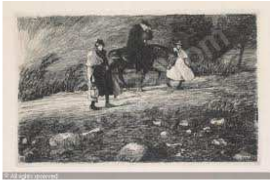
Apaiza zaldi gainean, Rikardo Barojaren margoa.

“...Y a esas razones llevo el abad de Errazquin... fue a ponerse a caballo en casa de esta testigo donde tenia su rocin para ir al lugar de Errazquin...”