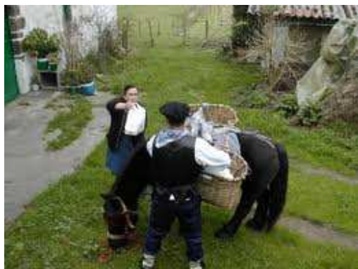
Puska biltzen pottokarekin Lizartzan.

Ezin ba ukatu zein garrantzi handia duen zaldiak gure Euskal kulturaren. .