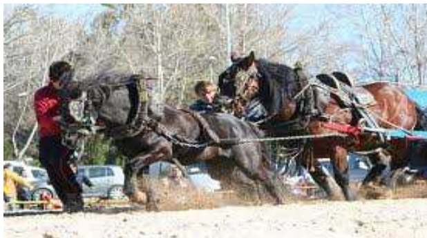
Zaldi proba Balentzian, puntako zaldikoa, pottoka dirudi, ezta?

Bestela, idi dema famatuen itzalean, tarteka ere zaldi probak egiten dira gure lurrian baino idi probak baino arrakasta txikiagoa dute. Alderantziz, Balentzian oraindik ospe handia dute zaldi probak: