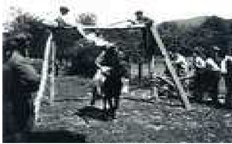
Oilar jokoak Lakuntzan 1930.

Antzar jokoak bukatu ondoren, askotan “ piperopil jokoak ” egiten zen zaldiekin, kasu honetan, piperopil borobil bat zintzilikatzen zen eta harren barrenean zaldunak eskuan zeraman burdinazko kako txiki bat sartu behar zuen.