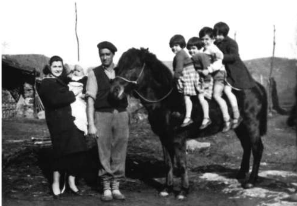
Famili Euskalduna bere pottokarekin. 1950 inguruan.

Harritzekoa, izan ere, kasu honetan, gure baserritar honek ez zuen ez behirik eta ez idirik, baina bai behor eta mando bat.