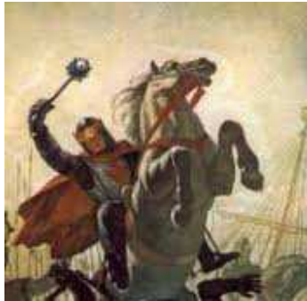
Antso VII Azkarra.

Beharbada,bera da gure errege Euskaldunetan ezagunena.