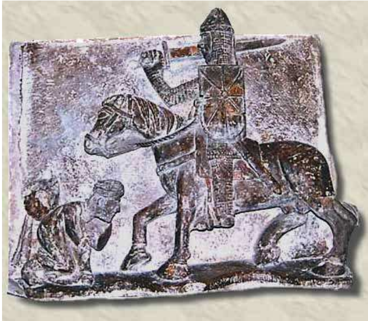
( Antso Azkarraren garaiko zaldun Nafarra, )

Baina ez bakarrik erregeak, jende umilak ere zaldiak, hobeto esanez, behorak bazituen, eta gainera ez nahi adina. Izan ere, garai hartan zaldien hazkuntza hain garrantzitsua izanik, erregulatua zegoen.