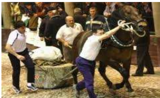
Zaldi probak Euskalherrian.

Lehen esan dugun bezela, gaur egungo gure bertako arrazako euskal zaldi-behor gehienak haragitarako ekoizten dira. Gainera ez ditugu guk jaten, izan ere gure herrian zaldi haragia jateko ohitura gutxi dago eta gehienak Balentziara edo Italiara joaten dira.