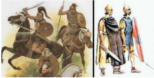
Erromatar garaiko zalduneria.

Legioa oinezko soldadu multzoez osatzen zen, ongi heziak eta diziplinatuak, Armada honek zalduneria ere eramaten zuen laguntzaile gisa eta Erromatarrek normalean, zalduneria menperatutako herrietan bilatzen zuten ,hori dela eta Sarmatak , Galiarrak, Iberiarrak zaldun bezela maiz hartzen zituzten Erromatarrek, eta baita Euskaldunak ere: