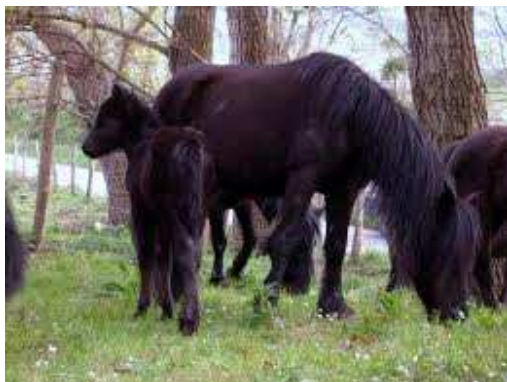
Pottoka bere moxalarekin.

Bestalde bere laburtasuna eta indarra oso aproposak egiten zituen laranja soroetan zuhaitz tartean ibiltzeko.