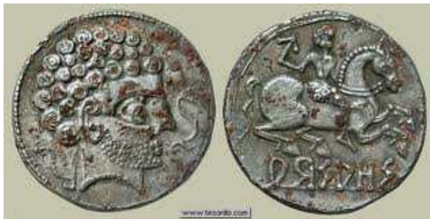
Erromatar garaiko Euskal txampona.

Aipatzekoa da ere, gure lurraldean aurkitu ziren lehen txanponen artean badira batzuk, “barskunes” idazkia eramaten dutenak, bertan, alde batetik, “Euskal buru “ bat ikus daiteke, eta bestaldetik, zaldi eta zaldun baten irudia: