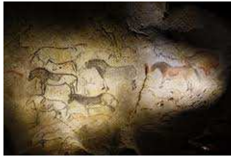
Argazkia, Ekaingo margoak.

Baina, zehatzak izatearren, garai hartan hemen bizi zen zaldia ez zen gaur egun ezagutzen duguna, baizik eta seguraski, haren arbaso bat, " equus caballus solutrensis " bezela ezagutua. Antzinako zaldi mota hau, duela 40.000 bat urte iritsi zen gurera Eurasiako estepetatik.